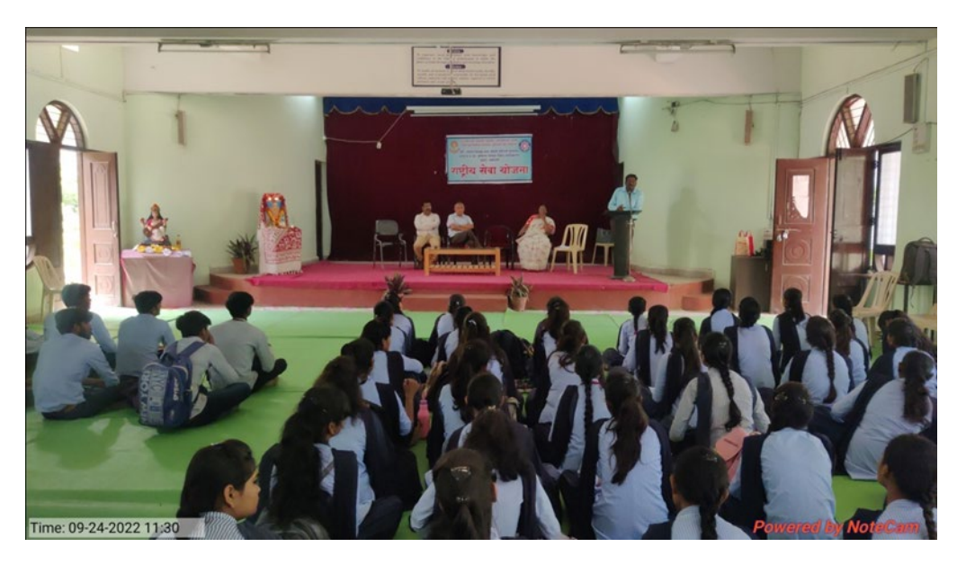
Clean India campaign