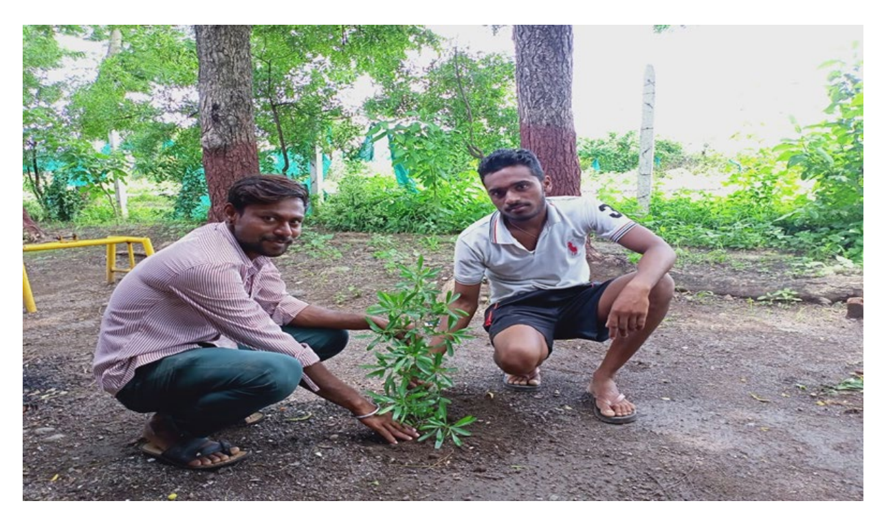
Healthy India Campaign Conducted from 15th August to 2nd September, 2020