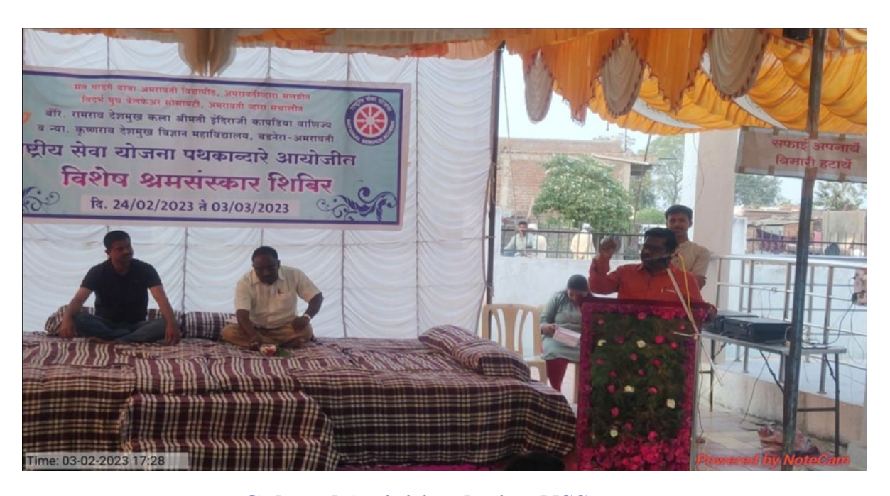
Cultural Activities during NSS camp