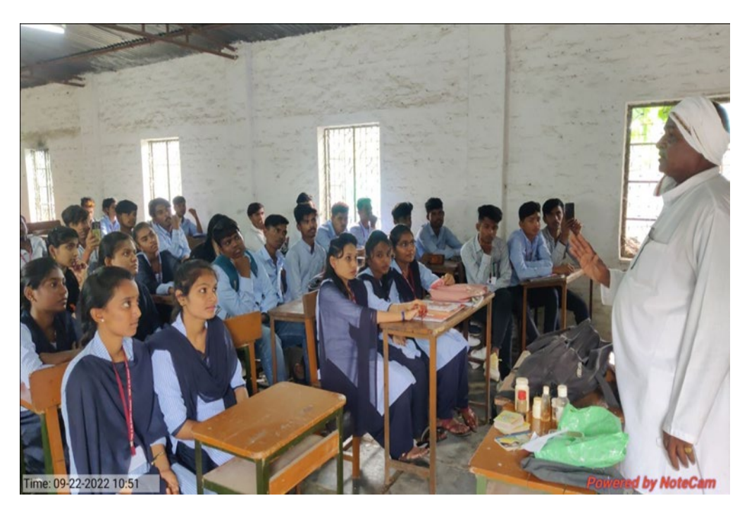
Guidance and Awakening program for NSS students