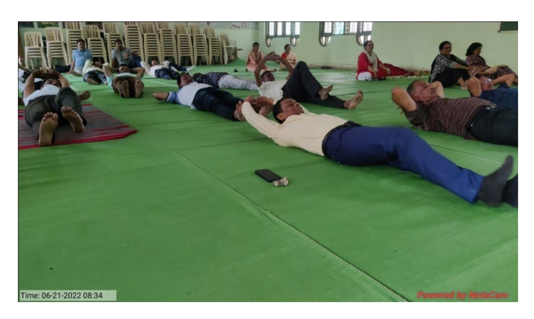
75 years of independence Amrit Mahotsav