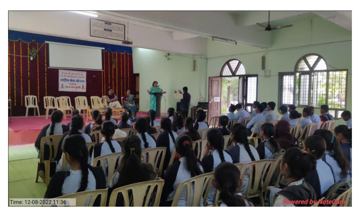
Blood donation camp held on 13/12/2022