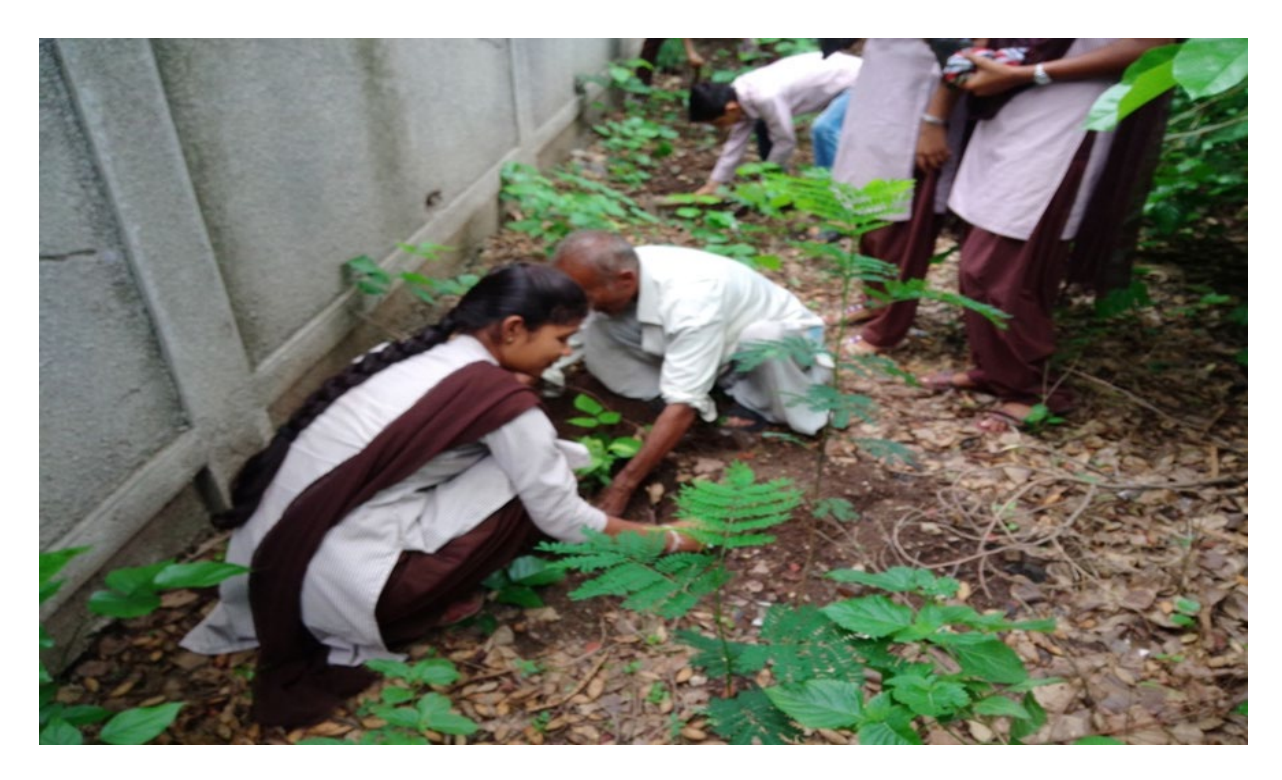
Clean India Mission Drive conducted on 15-18th August, 2019